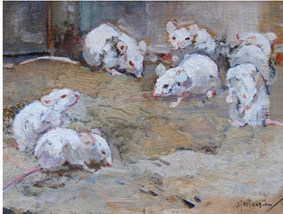
Een nest witte muizen. (Overigens niet uit de Koninklijke collectie)

Cornelis Jan Mension, die leefde van 1882 tot 1950, was in zijn tijd 'de koning van de dierenschilders', populair bij het gewone volk en zeer gewaardeerd tot in de hoogste societykringen.